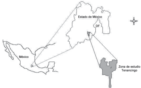
Figura 2. Zona de estudio: municipio de Tenancingo, Estado de México, México. 2002-2004.